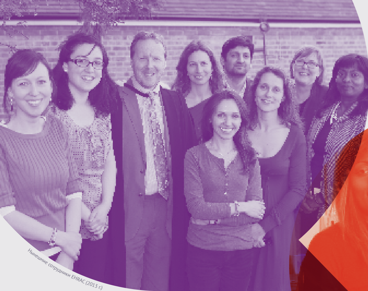
Нынешние сотрудники EHRAC (2013 г.)