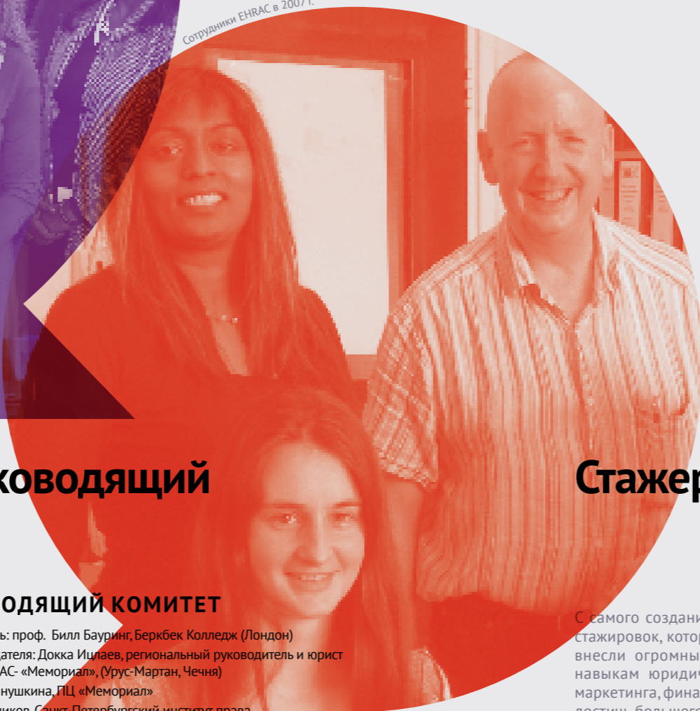
Сотрудники EHRAC в 2007 г.